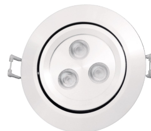
NTL-072-RD-9W-XX FINI BLANC