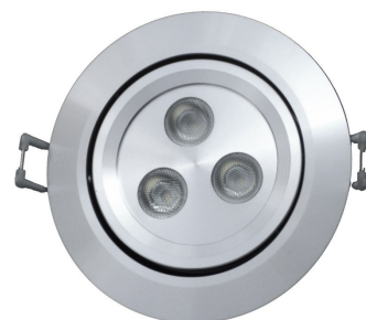
NTL-070-RD-9W-XX FINI ALUMINIUM SATINÉ